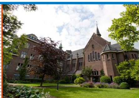
AAN HET SINT-JANSCENTRUM