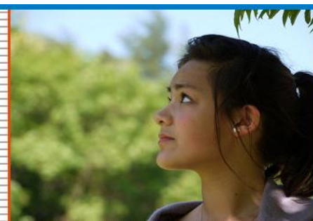
IN HET BISDOM VAN DEN BOSCH

Laat jezelf als levende stenen voegen in de bouw van de geestelijke tempel (1 Petrus 2,5)