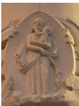
Sculptuur in de Rozenkransbasiliek te Lourdes

verworvenheden van de klassieke oudheid. Men verspreidde graag de legende dat de Middeleeuwers geloofden dat de aarde plat was, hoewel de Grieken al in 500 voor Christus hadden vastgesteld dat de wereld bolvormig was. De meeste Europeanen hebben hier sindsdien aan vastgehouden. Ook Thomas van Aquino ging er van uit dat de bolvormigheid van de aarde wetenschappelijk was aangetoond. Diezelfde Thomas van Aquino was weliswaar van mening dat meerdere engelen op hetzelfde moment op dezelfde plaats konden zijn, maar hij noch andere academici hebben zich ooit bezig gehouden met het vraagstuk hoeveel engelen zich op een speldenknop konden bevinden. De eerste aanwijzing voor dit onnozele louter academische vraagstuk dateert van 1618 (een protestant). Er lag ook geen taboe op lijk-schouwing in de Middeleeuwen (deze praktijk kwam overgewaaid uit het Midden-Oosten), en specerijen werden niet benut om de vreselijke geur en smaak van rottend vlees te maskeren: deze specerijen waren luxe-artikelen. Nog zoiets: